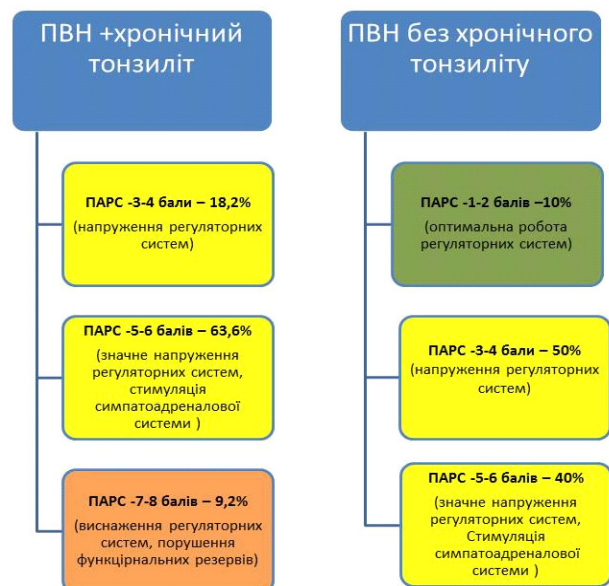
Рис.2. Показник активності регуляторних систем за даними варіабельності серцевого ритму у пацієнтів з ПВН

При оцінці результатів бульбарної мікроскопії також визначається залежність судинних порушень від наявності ЛОР-патології. Так, при хронічному тонзиліті виявлені судинні порушення у вигляді нерівномірності калібру судин (52%), одиничних мікроаневризм (60%), м'ядричної звивистості капілярів (88%) і венул (48%), одиничних артеріоло-венулярних анастомозів (25%). А також спостерігаються позасудинні порушення у вигляді мікрогеморагії (16%) і периваскулярного набряку у 12% хворих. (табл.1)